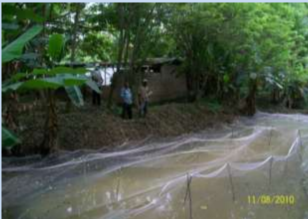
Filet contre les oiseaux prédateurs